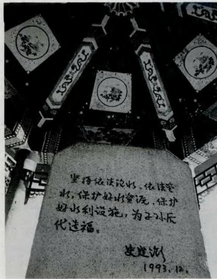
> 图6 玉泉山北坡的一座碑亭

明成祖朱棣迁都北京后，因衙署不足，又没有地址兴修，1419年便将南面城墙向南展拓，由长安街线上移到现在的位置。南北两墙改建的工程使整个北京城约略向南移动四分之一，这完全是经济和政治的直接影响。且为了元的故官已故意被破坏过，重建时就又作了若干修改。最重要的是因不满城中南北中轴线为什刹海所切断。将宫城中线向东移了约150米，正阳门、钟鼓楼也随着东移，以取得由正阳门到鼓楼、钟楼中轴线的贯通，同时又以景山横亘在皇宫北面如一道屏风这个变动便景山中峰上的亭子成了全城南北的中心，替代了元朝的鼓楼的地位。这50年间陆续完成的三次大工程便是北京在辽以后的第三次改建。这时的北京城就是今天北京的内城了。