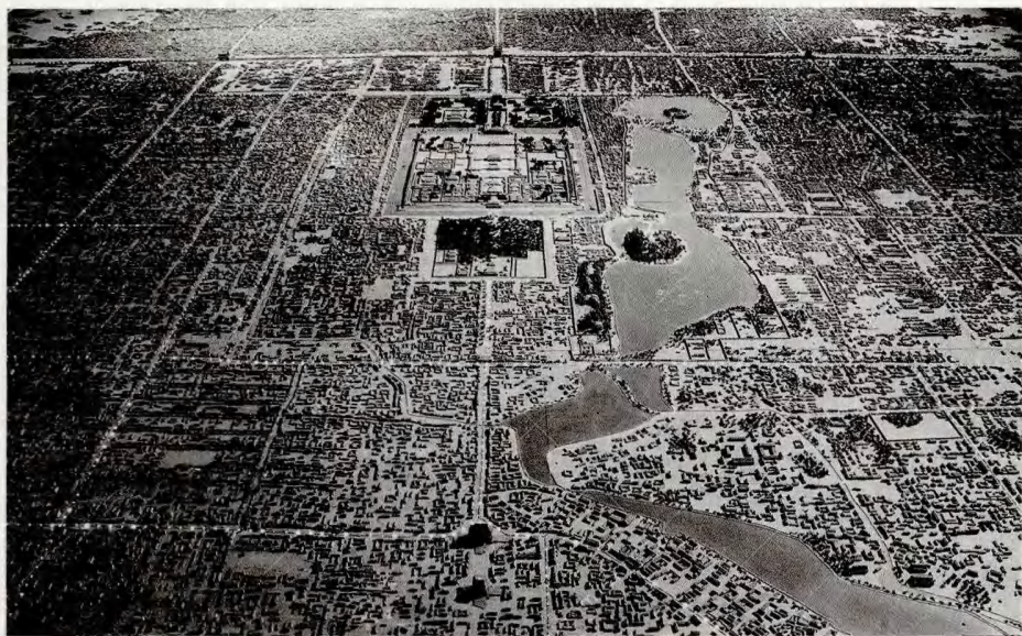
> 图7 北京的城市格式

重地影响着北京的经济和全市居民的健康。在有铁路以前，北京与南方的粮运完全靠运河。由北京到通州之间的通惠河一段，顺着西高东低的地势，须靠由西北来的水源。这水源还须供给什刹海、三海和护城河，否则它们立即枯竭，反成孕育病疫的水桂，水源可以说是北京的生命线。北京近郊的玉泉山的泉源虽然是“天下第一”（图5-6），但水量到底有限；供给池沼和饮料虽足够，但供给航运则不足了。辽金时代航运水道曾利用高粱河水，元初则大规模地重新计划。起初曾经引永定河水东行，但因夏季山洪暴发，控制困难，不久即放弃。当时的河渠故道在现在西郊新区之北，至今仍可辨认。废弃这条水道之后的计划是另找泉源。于是便由昌平县神山泉引水南下，建造了一条石渠，将水引到瓮山泊（昆明湖）再由一道石渠东引入