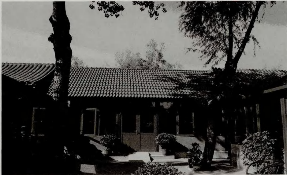
> (图3-4) 改建后的四合院

对象，所以汴梁的许多匠人曾被迫随着金军到了北京，为金的统治阶级服务。金朝在北京曾不断地营建，规模宏大，最重要的还有当时的离宫，今天的中海北海。辽以后，金在旧城基础上扩充建设，便是北京第一次的大改建，但它的东面城墙还在现在的琉璃厂以西。