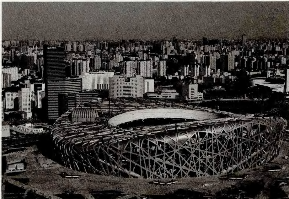
> 图1 现代北京城

中国人民的首都北京，是一个极年老的旧城，它曾经是封建帝王威风的中心，今天它却是初落成的、照耀全世界的民主灯塔。它有丰富的政治历史意义，更要发展无限文化上的光辉。