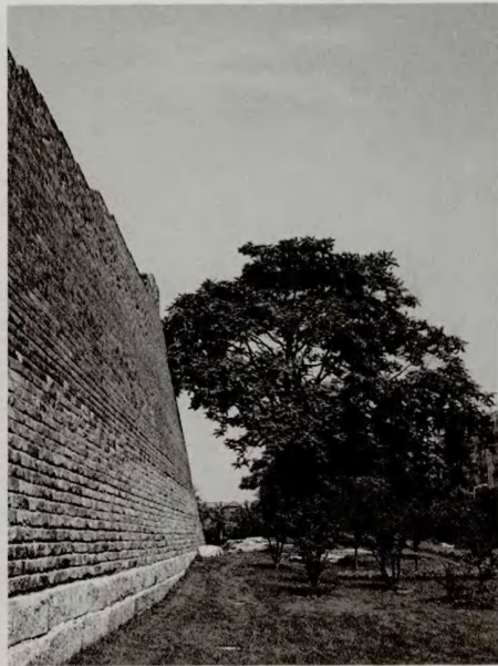
> (图12-13) 北京城墙

将要接踵地兴建起来，街道系统将加以改善，千百条的大街小巷将要改观，各种不同性质的区域要划分出来。北京城是必须现代化的；同时北京城原有的整体文物性特征和多数个别的文物建筑又是必须保存的。我们必须“古今兼顾，新旧两利”。我们对这许多错综复杂问题应如何处理？是每一个热爱中国人民首都的人所关切的问题。