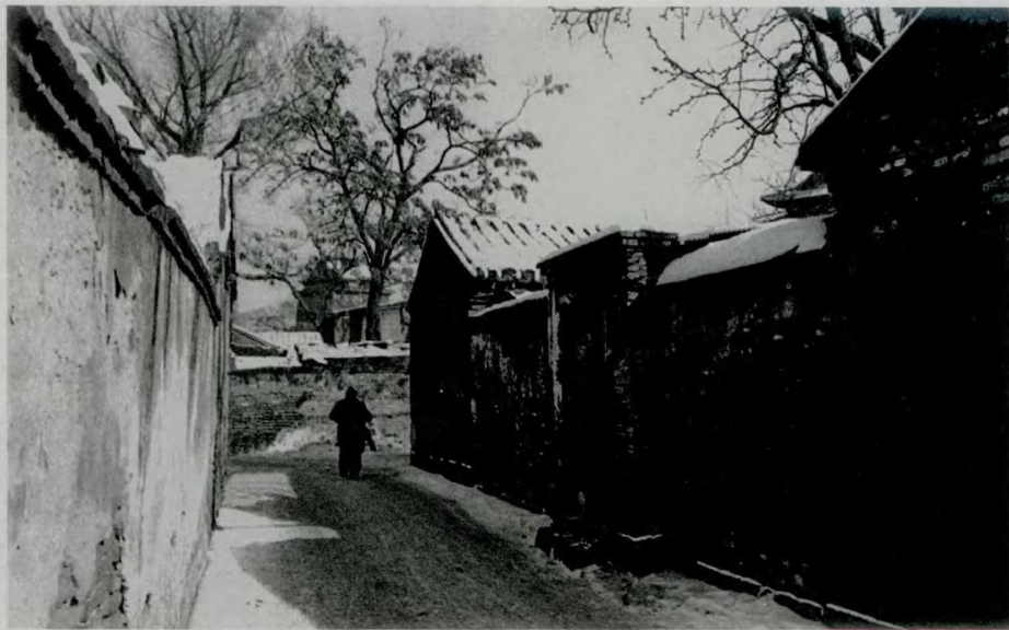
> 图2 老北京城的住宅

北京的高度约为海拔50米，地质学家所研究的资料告诉我们，在它的东南面比它低下的地区，四五千年前还都是低洼的湖沼地带。所以历史学家可以推测，由中国古代的文化中心的“中原”向北发展，势必沿着太行山麓这条50米等高线的地带走。因为这一条路要跨渡许多河流，每次便必须在每条河流的适当的渡口上来往。当我们的祖先到达永定河的右岸时，经验使他们找到那一带最好的渡口。这地点正是我们现在的卢沟桥所在。渡过了这个渡口之后，正北有一支西山山脉向东伸出，挡住去路，往东走了十余公里，这支山脉才消失到一片平原里。所以就在这里，西倚山麓，东向平原，一个农业的民族建成了一个最有利于发展的聚落，当然是适当而合理的。北京的位置就这样地产生了。并且也就在这里，他们有了更重要的发展，同北面的游牧民族开始接触，是可以由这北京的位置开始，分3条主要道路通到北面的山岳高原和东北面的辽东平原的。那三个口子就是南口、古北口和山海关。北京可以说是向着这三条路出发的分岔点，这也成了今天北京城主要构成原因之一。北京是河北平原早路北行的终点，又是通向“塞外”高原的起点。我们的祖先选择了这地方，不但建立一个聚落，并且发展成中国古代边区的重点，完全是适应地理条件的活动。这地方经过世代的发展，在周朝为燕国的都邑，称做蓟；到了唐是幽州城，节度使的府衙所在；在五代和北宋是辽的南京，亦称做燕京；在南宋是金的中都；到了元朝，城的位置东移，建设一新，成为全国政治的中心，就成了今天北京的基础。最难得的是明清两代易朝代换的时候都未经太大的破坏就又在旧基础上修建展拓。随着条件发展，到了今天，城中每段街、每一个区域都