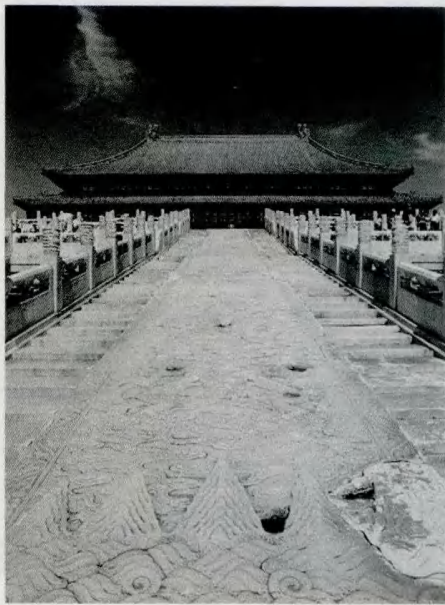
> 图11 北京故宫太和殿

国人民的瓔珞了。古史上有许多著名的台——古代封建主的某些殿宇是筑在高台上的,台和城墙有时不分一后来发展成为唐宋的阁与楼时,则是在城墙上含有纪念性的建筑物,大半可供人民登临。前者如春秋战国燕和赵的丛台、西汉的未央宫、汉末曹操和东晋石赵在邺城的先后两个铜雀台,后者如唐宋以来由文字流传后世的滕王阁、黄鹤楼、岳阳楼等。宋代的宫前门楼宣德楼的作用也还略像一个特殊的前殿,不只是一个仅具形式的城楼。北京峭峙着许多壮观的城楼角楼,站在上面俯瞰城郊,远览风景,可以供人娱心悦目,舒畅胸襟。但在过去封建时代里,因人民不得登临,事实上是等于放弃了它的一个可贵的作用。今后我们必须好好利用它为中国人民服务。现在前门箭楼早已恰当地作为文娱之用。在北京市各界