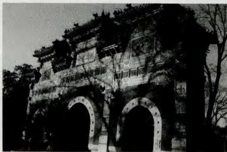
> (图9-10) 上:北京太庙;下:北京国子监